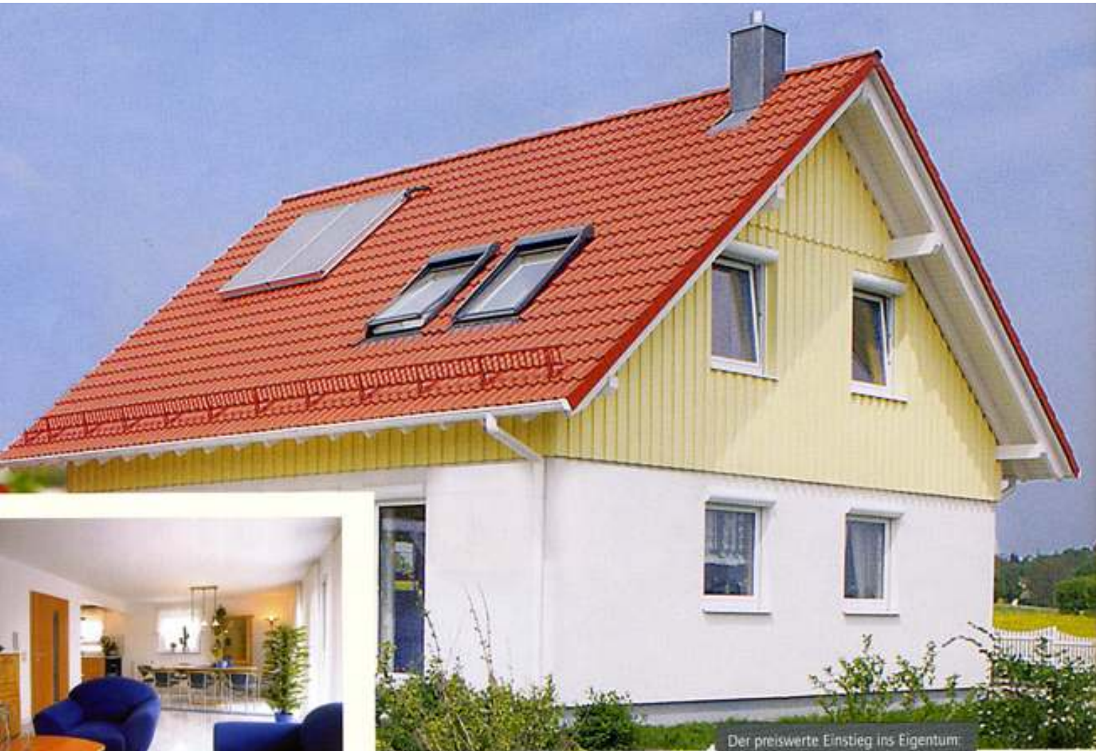
Der preiswerte Einstieg ins Eigentum bescheiden, aber praktisch