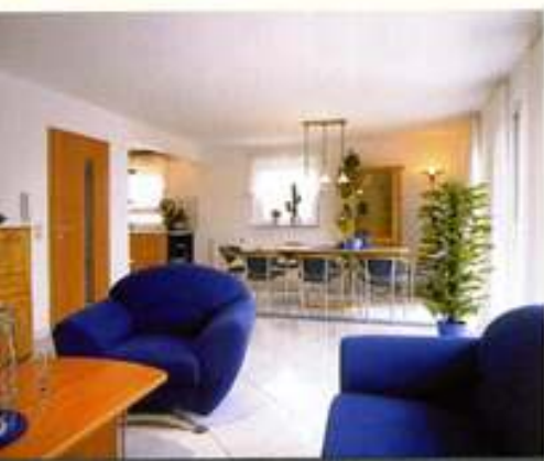
Wohn- und Esszimmer: 34 Quadratmeter groß

Ab 69.201 Euro kann man „Vario Trend“ von Weiss Holzhausbau bekommen – auch für ein Ausbauhaus ein sehr günstiger Preis. 110 Quadratmeter werden dafür geliefert, ab 138.115 Euro sind sie schlüsselfertig ausgebaut.