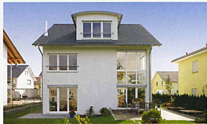
Zahlreiche Verglasungen und eine große Gaube holen eine Extraportion Tageslicht in das Haus der Neumanns. Auf diese Weise kann die Familie nicht nur auf der Terrasse Abendsonne tanken.