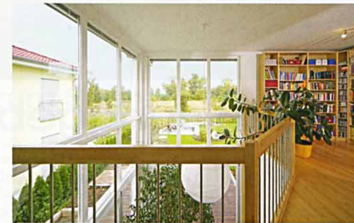
Raffiniert: Sowohl die Galerie im Obergeschoss als auch der Essplatz im Erdgeschoss bieten einen traumhaften Blick ins Grüne. Möglich macht das die sich über zwei Geschosse erstreckende Eckverglasung.

Offen, aber durch eine geschickte Raumplanung dennoch strukturiert präsentiert sich das Erdgeschoss. Hier wurden die Bereiche Wohnen, Essen und Kochen L-förmig angelegt. Im voll verglasten Hauseck platzierten die Neumanns den Esstisch, an dem gemeinsam geschlemmt wird und ein reger Austausch mit den anderen Familienmitgliedern stattfindet. Ebenfalls im Erdgeschoss finden Übernachtungsgäste in einem hübschen kleinen Zimmer neben dem Hauseingang eine gemütliche Unterkunft. Praktisch für diese, aber auch für anderen Besuch ist das direkt daneben gelegene Dusch-WC.