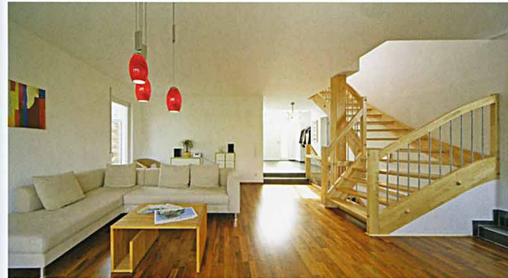
Das offene Wohnkonzept macht sich bezahlt: Wenn die Sonne scheint, lässt sie das gesamte Geschoss erstrahlen und verleiht ihm eine besonders freundliche und einladende Atmosphäre.